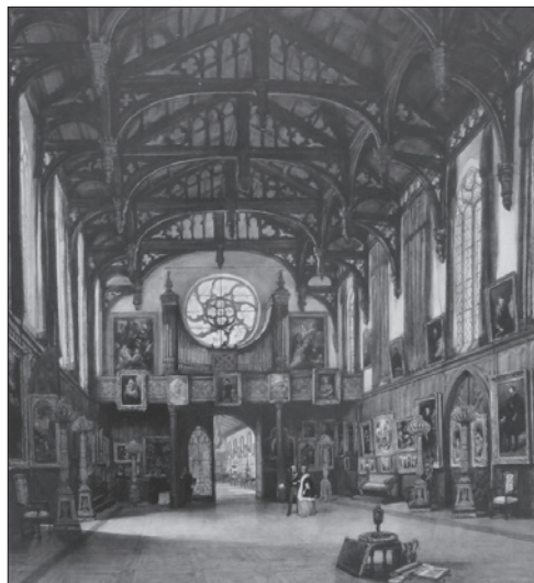
De Gotische Zaal in Den Haag met de schilderijenverzameling van koning Willem II