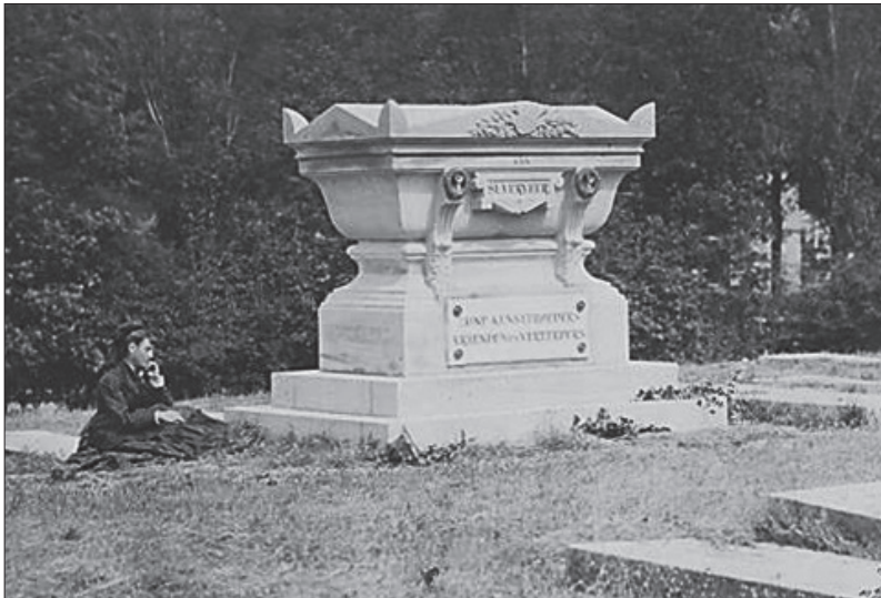
Grafmonument van Salomon Vermeer, ca. 1890