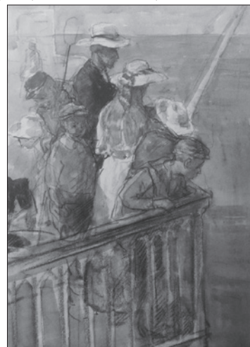
Dagje uit op de Scheveningse pier