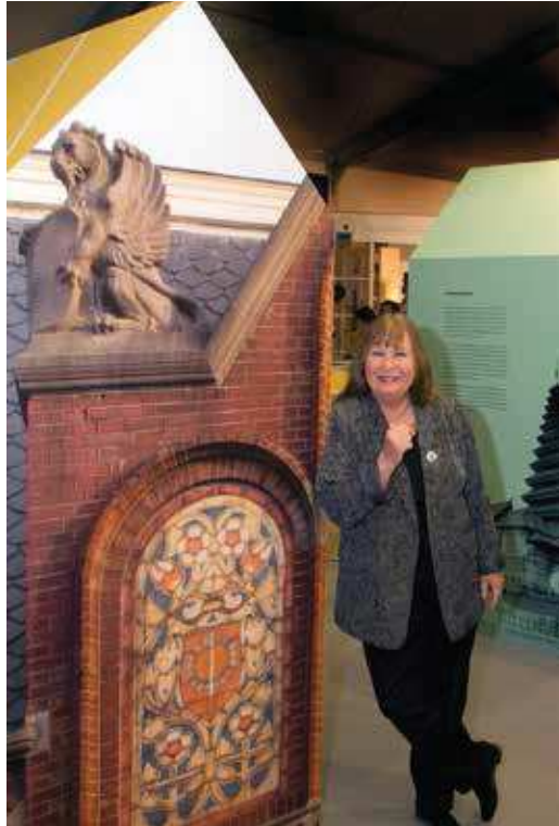
1. Op de Tong Tong Fair 2013 was het project Sporen van Smaragd. Indisch erfgoed in Den Haag, 1853-1945 prominent aanwezig.