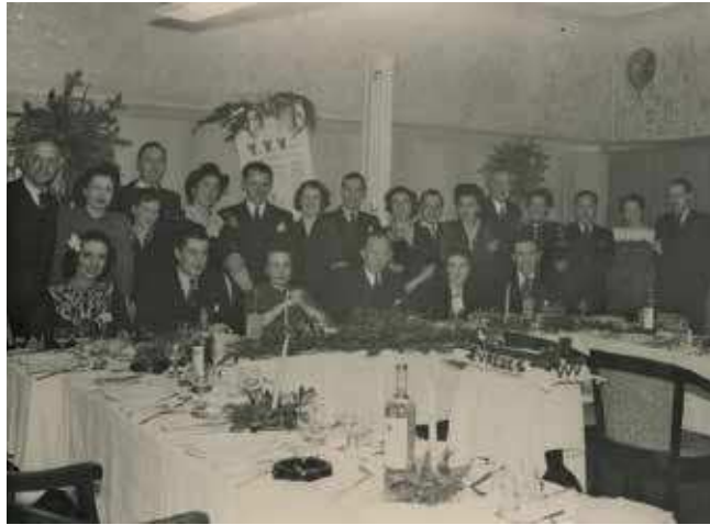
1. De leden van Kegelclub Vrijaf van Vrouwen met hun partners op het Vredesdiner op 22 december 1945.

Deze archieven zijn veelal nog niet door middel van inventarissen toegankelijk en in een aantal gevallen bovendien nog niet of beperkt raadpleegbaar. Wie een nieuw verworven archief wil inzien, kan het beste hierover eerst contact opnemen met het Haags Gemeentearchief.