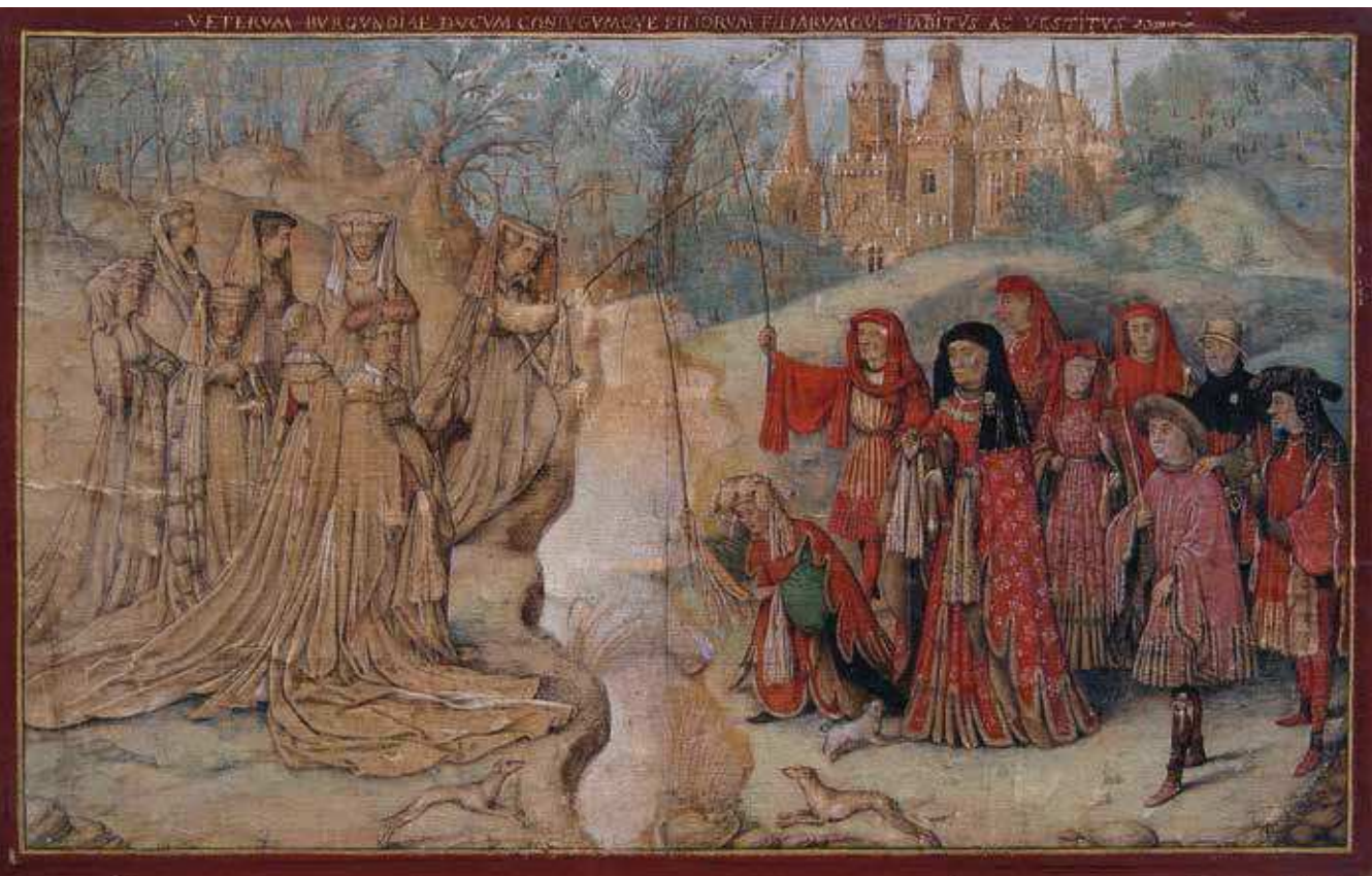
1. De vispartij, toegeschreven aan Jan van Eyck, circa 1420-1425. Parijs, Musée du Louvre.