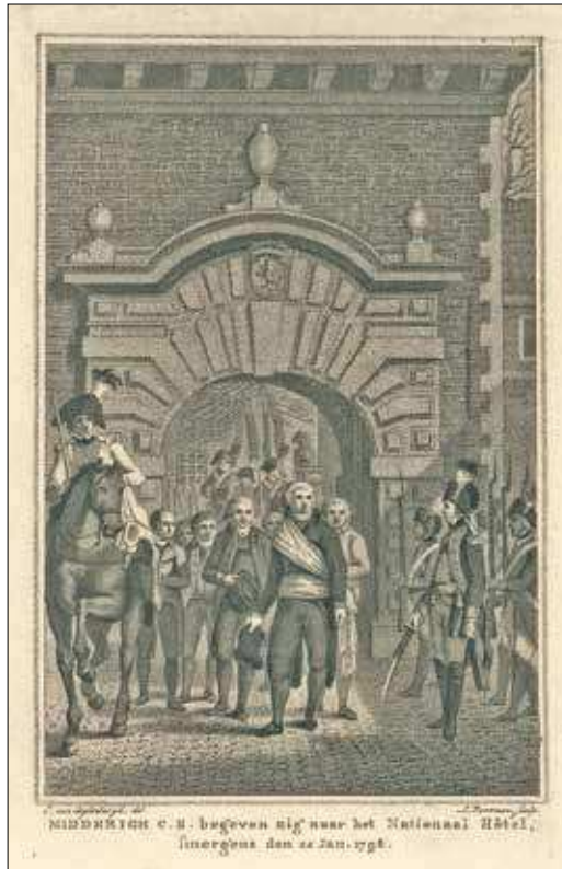
1. De aanstichters van de staatsgreep van 22 januari 1798 betreden via de Mauritspoort het Binnenhof om naar de vergaderzaal van de Nationale Vergadering te gaan.

Het eerste gedeelte van deze bijdrage schetst de stappen, die leidden tot ingebruikneming van het Oude Hof 2 , waarbij voor een goed begrip de daarbij behorende politieke gebeurtenissen