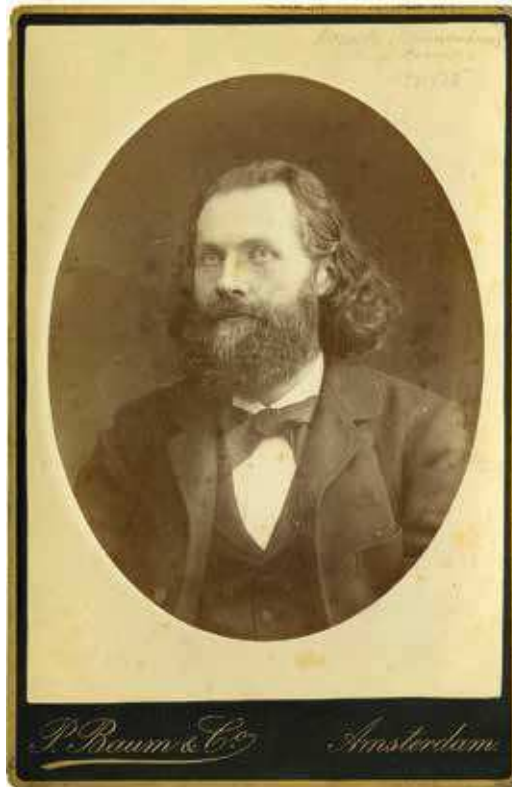
1. Portret van Ferdinand Domela Nieuwenhuis.

De weinig geïndustrialiseerde Nederlandse steden hadden in deze periode te maken met weinig werkgelegenheid en een groeiend aanbod aan arbeidskrachten. Door de import van goedkoop graan verloren veel boeren hun werk en trokken zij naar de steden om voor lage lonen te werken in de fabrieken. Door de omvang van de arbeidsmigratie en andere factoren, zoals het