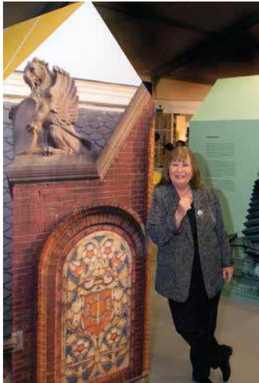
1. Op de Tong Tong Fair 2013 was het project Sporen van Smaragd. Indisch erfgoed in Den Haag, 1853-1945 prominent aanwezig.