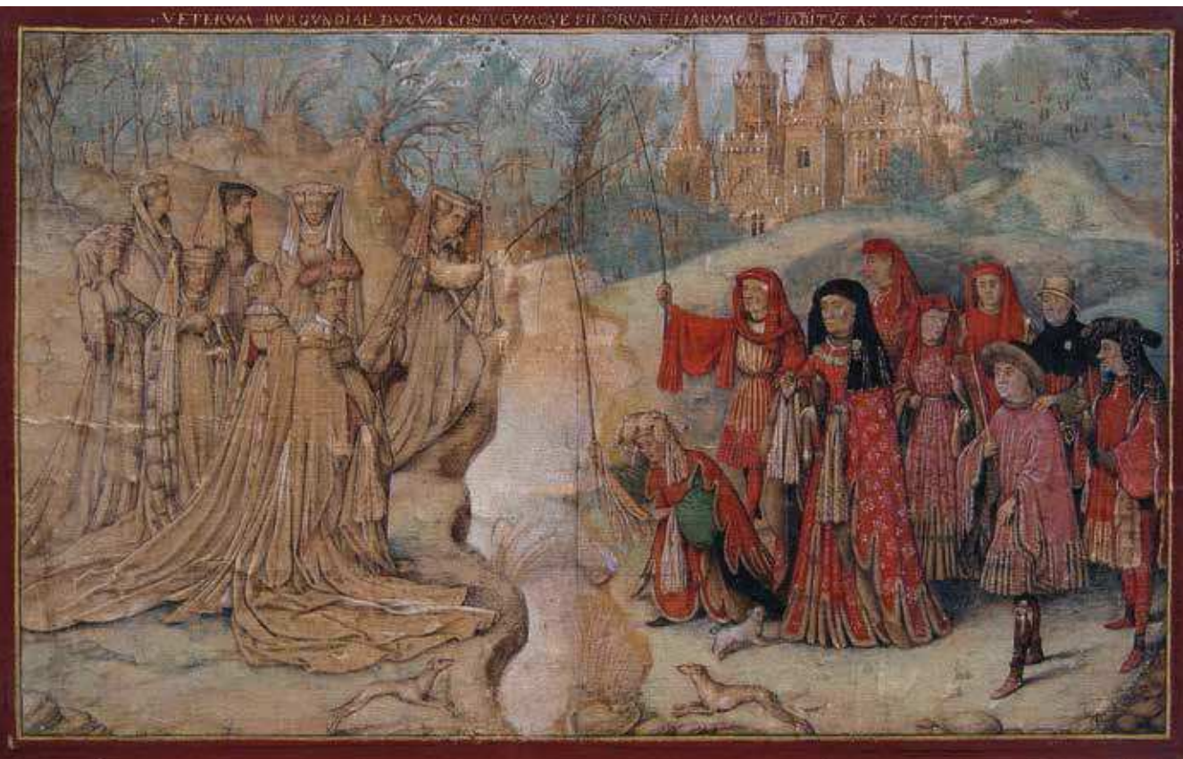
1. De vispartij, toegeschreven aan Jan van Eyck, circa 1420-1425. Parijs, Musée du Louvre.