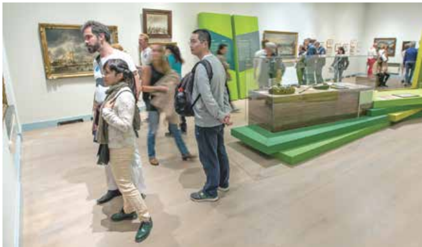
1. De tentoonstelling 'Nederland Golf!'

Haagse Humor. Spotten met de politiek was de eerste nieuwe tentoonstelling die in het Haags Historisch Museum was te zien. Aan de hand van spotprenten en tv-fragmenten werd een beeld geschetst van de geschiedenis van de politieke satire in Nederland. Corifteen als Wim de Bie, Sander van de Pavert (Lucky TV)