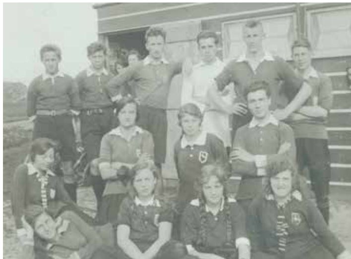
1. Ons Eibernest in het seizoen 1922-1923. Dit is één van de circa 370 foto's in het archief HKV/Ons Eibernest.

De Haagse jeu-de-boulesclub 'Pétanque' werd opgericht in 1962. De club, speciaal voor senioren bedoeld, telde in het begin tien leden, maar groeide uit tot