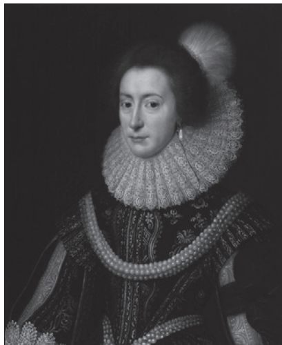
Portret van Elizabeth van Bohemen