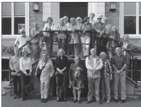
Deelnemers aan de excursie Haags Porselein voor het huis Dunne Bierkade 18

We hebben ons de vaak gehoorde klacht ter harte genomen dat de activiteiten zo snel volgeboekt zijn. Daarom proberen we niet alleen meer excursies te organiseren, maar ook programmaonderdelen te herhalen wanneer daar behoefte aan is. Dat geeft ons tevens de mogelijkheid aan een andere wens tegemoet te komen, namelijk het meenemen van introducés. Voor u een