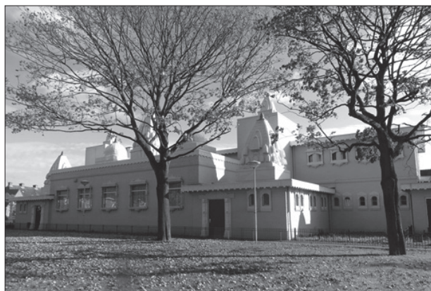
Het Hindoeceentrum Sewa Dhaam

NB: houdt u er rekening mee dat u het tempelgedeelte alleen zonder schoenen mag betreden.