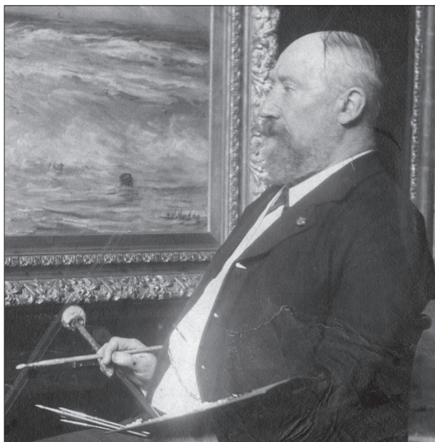
H.W. Mesdag voor een van zijn schilderijen.

Na ontvangst van uw bijdrage op rekening NL49 INGB 0000 0717 91 t.n.v. Geschiedkundige Vereniging Die Haghe zal uw deelname worden bevestigd.