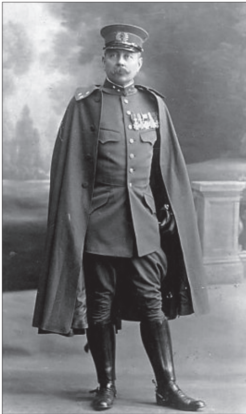
Majoor Lodewijk Thomson (1869-1914).

In het kader van onze jubileumtentoonstelling 'Held op sokkel' organiseren wij in januari twee interessante lezingen waarin twee 'helden' nader zullen worden belicht.