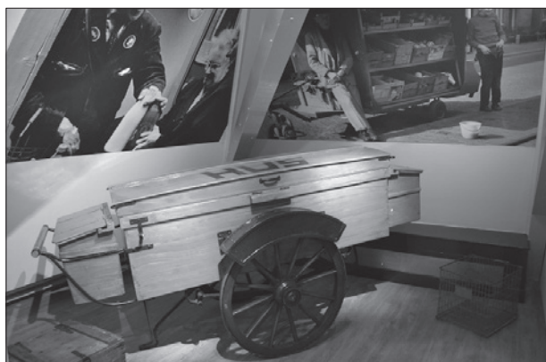
De bakkerskar van Hus.

Het verlies voor Den Haag na de Tweede Wereldoorlog was groot: joodse Hagenaars waren veelal vermoord, het