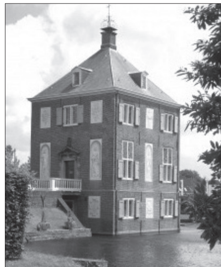
Huygens' Hofwijck in Voorburg.

De beroemde buitenplaats van Constantijn en Christiaan Huygens in Voorburg werd in 2013 van binnen gerestaureerd en kreeg twee nieuwe museale opstellingen: De Gouden Eeuw van Constantijn en Christiaan onder de Sterren . De ijskelder werd teruggebracht in zijn oorspronkelijke staat en ook de tuin werd in ere hersteld. Met de feestelijke opening van een nieuw entreegebouw (met tearoom!) eind vorig jaar werd het project Het nieuwe Hofwijck afgerond. Kortom, redenen genoeg voor een rondleiding door het vernieuwde Hofwijck.