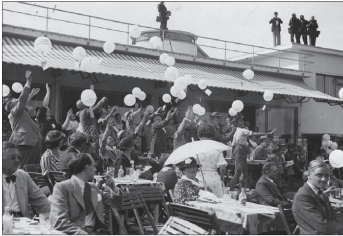
Opening van het vliegveld Ypenburg op 29 augustus 1936

Op zondag 2 oktober organiseert Die Haghe in samenwerking met de Historische Vereniging Buitenplaats Ypenburg een lezing over het vliegveld met aansluitend een rondleiding, die wordt afgesloten met een borrel.