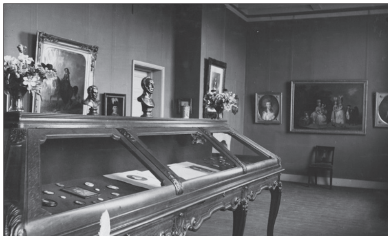
Interieur van het Oranje-Nassau Museum in de Boterwaag, ca. 1930

Aanmelden: zie boven (onder 'Activiteiten')