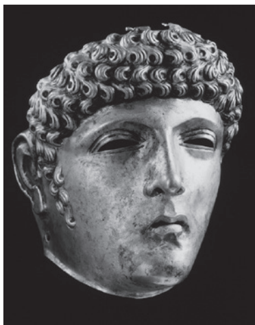
Romeins pronkmasker (Coll. Erfgoed Leiden en Omstreken)

pen aan de Romeinen. Hierover is een reizende tentoonstelling gemaakt, 'Romeinse kust' die tot en met 15 oktober te zien is in Muzee Scheveningen. In de tentoonstelling maakt de bezoeker een virtuele wandeling langs de kust van Texel tot Zeeland, zo rond 200 na Christus. Uiteenlopende objecten geven een indruk van het leven van zowel inheemse bewoners als Romeinen. Maquettes en 'artist impressions' van forten, schepen en havens brengen het leven bij het water in beeld. Er zijn gebruiksvoorwerpen te zien zoals kookpotten, weefgewichten en dobbelstenen, en ook fraai versierd wapentuig, godenbeeldjes, handelswaar en kostbaarheden zoals ringen en andere sieraden. Heel bijzonder zijn een bronzen pronkmasker dat tijdens toernooien en parades door Romeinse ruiters werd gedragen en de in 2014 bij de Rotterdamse Baan in aanleg gevonden zilverschat: meer dan 100 zilveren munten uit de Romeinse tijd en enkele zilveren sieraden. Bij de tentoonstelling hoort een rijk geïllustreerd boekje (9,95 euro).