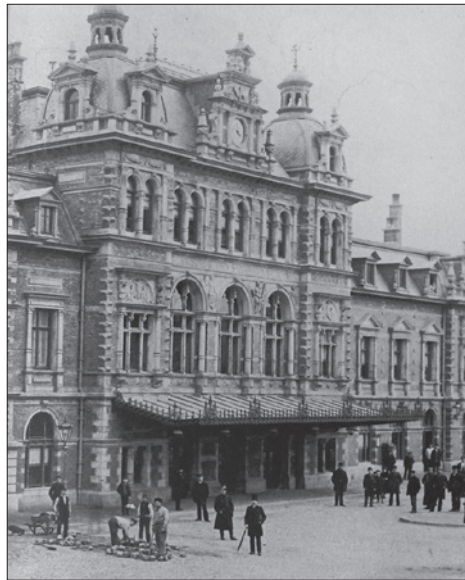
Ingang station Hollands Spoor

Den Haag maakte een snelle economische ontwikkeling door in die periode en vooral rond het station was dat goed te zien. Daar vestigden zich IJzergieterij L.I. Enthoven en Co, Smederij Sterkman en andere ambachtelijke en industriële bedrijven. De gemeente had het gebied oorspronkelijk bedoeld voor de huisvesting van welgestelden met fraaie huizen zoals rond het Oranjeplein. Maar de bedrijvigheid trok vooral ambachtslieden en arbeiders, voor wie volkswoningbouw ontstond in dit gebied. Al gauw bleek het stationsgebouw te klein voor de dagelijkse stroom passagiers en daarom werden plannen gemaakt voor een nieuw station, dat als een 'kathedraal van de nieuwe technologie' het symbool werd van het moderne industriële tijdperk. De bouw werd in twee fasen uitgevoerd: men begon in 1887 met de verhoogde perroneilanden met overkappingen, restauratie en dienstruimten. Drie jaar later startte men met de sloop van het oude gebouw en de bouw van het nieuwe in Hollandse neorenaissancestijl ontworpen station. De architect hiervan was D.A.N. Margadant, die als zoon van een Haagse bouwkundig opzichter was opgeklommen tot spoorwegarchitect