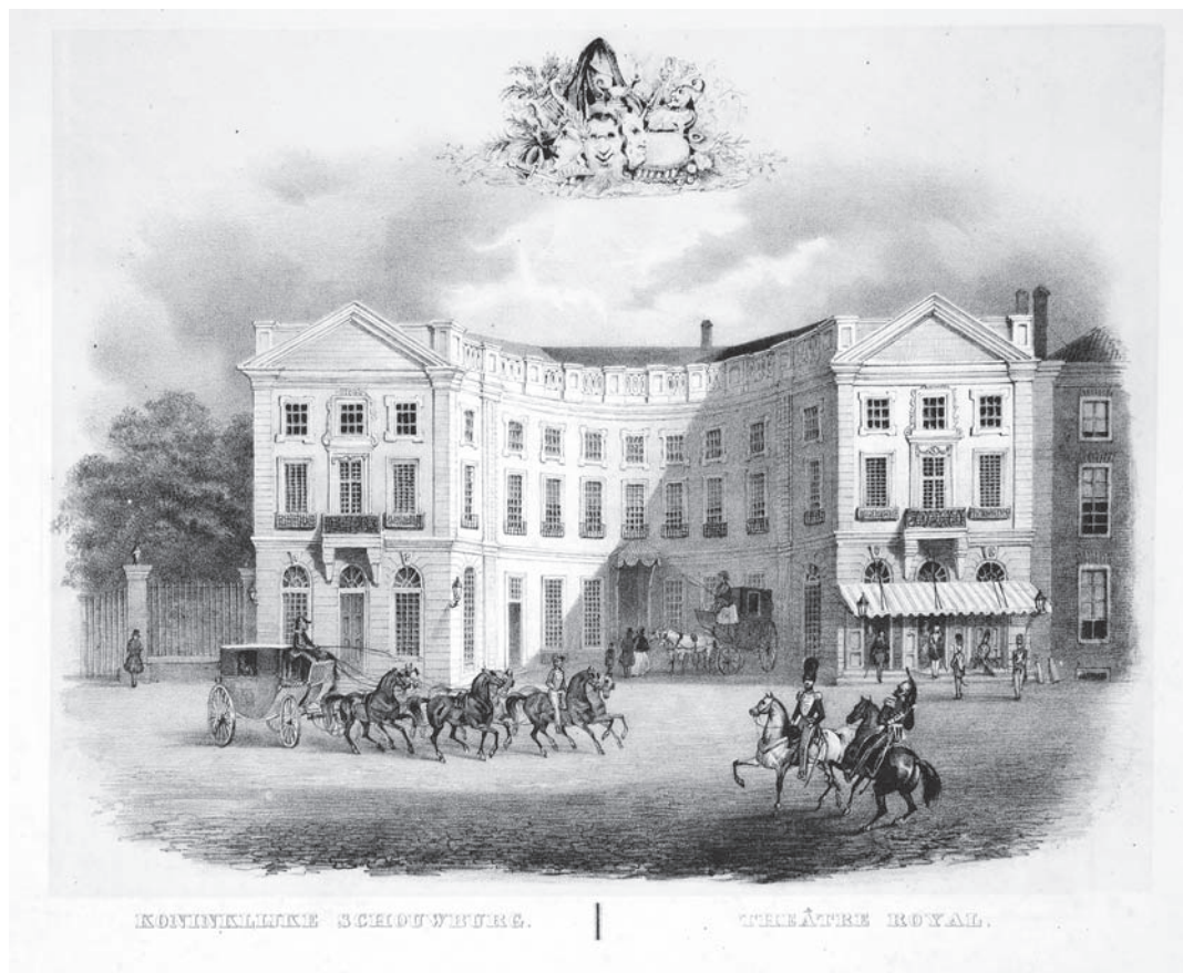
1. De Koninklijke Schouwburg aan het Korte Voorhout. Litho in kleur, 1844. Collectie Haags Gemeentearchief.