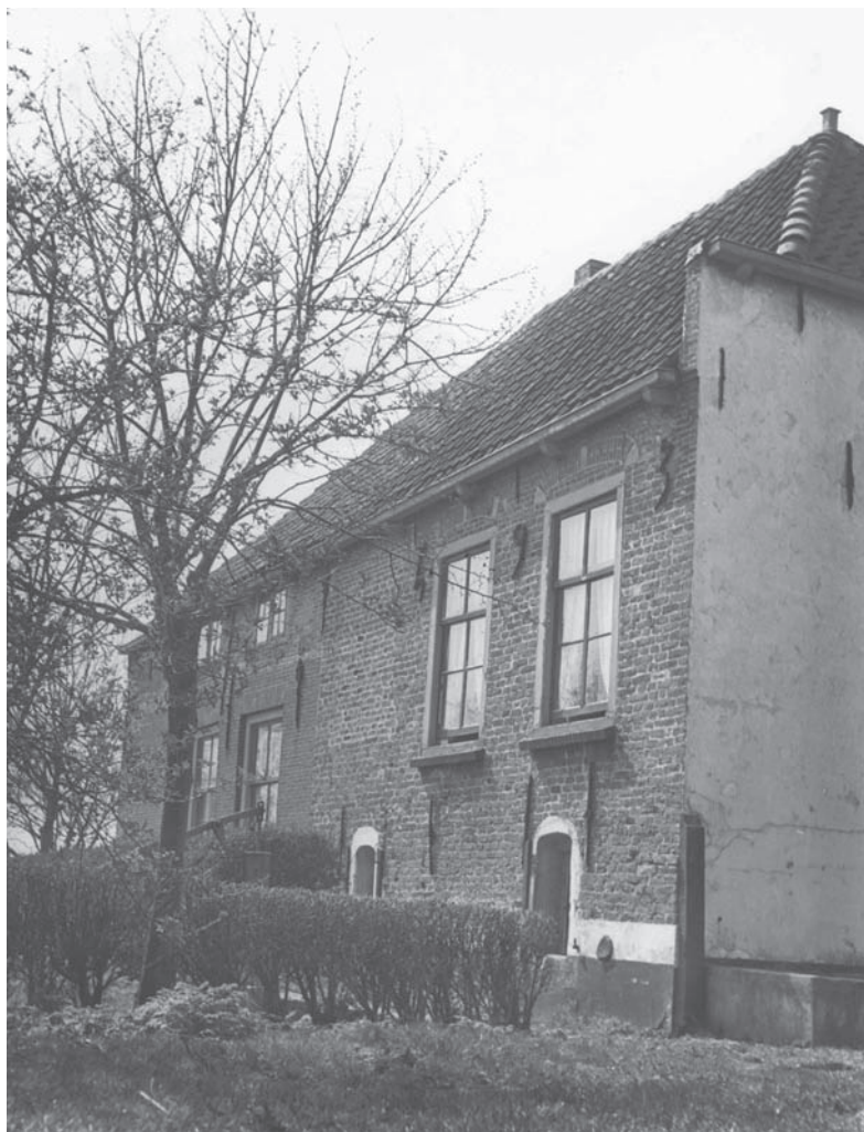
30. Lozerlaan, boerderij Vrederust, 1956.