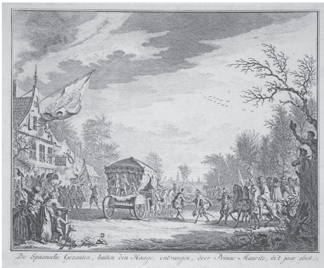
1. Prins Maurits ontvangt op 1 februari 1608 de Spaanse gezant markies Spinola bij de Hoornbrug. Ets naar Simon Frisius, Collectie Haags Gemeentearchief.