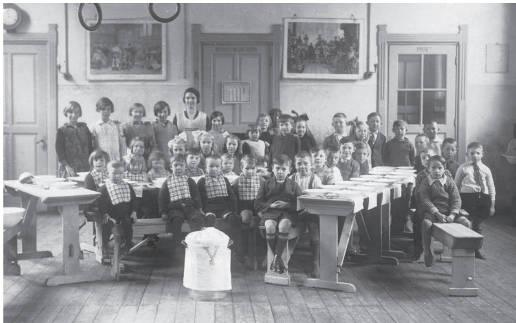
1. Kinderen in afwachting van het eten. Foto: particuliere collectie, 1929.

In dit artikel beschrijf ik de geschiedenis van de Haagse Vereeniging 'Kindervoeding'. Door deze vereniging werd van 1884 tot 1934 tussen de middag een warme maaltijd verstrekt aan schoolkinderen uit arbeidersgezinnen. Bij de oprichting gingen 33 kinderen onder schooltijd voor deze