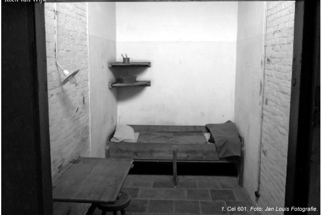
1. Cel 601.

Eens per jaar verzamelt zich een grote groep mensen in de sportzaal van de Penitentiaire Inrichting Haaglanden aan de Van Alkemadelaan. 1 Zij komen deze ochtend bijeen om hen te gedenken die hier tijdens de bezettingsjaren