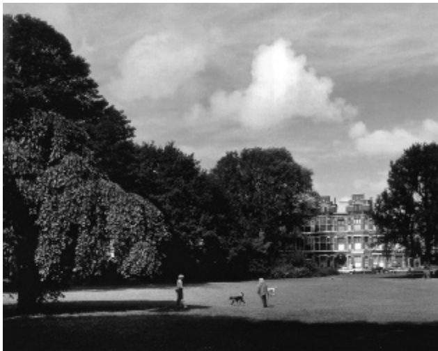
1. Het Frederik Hendrikplein. Om dit soort fraaie stadsgezichten duurzaam in stand te houden richt pijler 1 uit het project 'Modernisering Monumentenzorg' zich op de integratie van de cultuurhistorie in de ruimtelijke ordening.

In het verslag over 2008 werd gewag gemaakt van belangwekkende ontwikkelingen op rijksniveau: het project 'Modernisering Monumentenzorg', kortweg 'MoMo' van minister Plasterk van Onderwijs, Cultuur en Wetenschap. Zijn toen verschenen 'MoMo-contouren' – het document 'Een lust, geen last. Visie op de modernisering van de monumentenzorg' – is in september 2009 gevolgd door de 'Beleidsbrief MoMo', waarin drie 'pijlers' centraal staan: cultuurhistorische belangen meewegen in de ruimtelijke ordening, krachtiger en