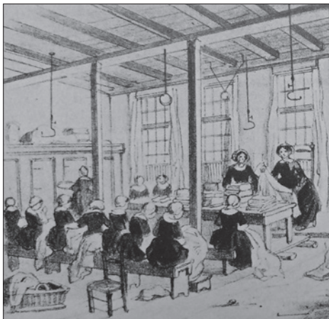
De linnennaikamer in het Oude Vrouwen en Kinderhuis, 1861

joodse en een Portugees joods, een remonstrants en een oud-katholiek lid. Tot 1871 bleek dit een slagvaardige organisatie.