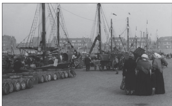
Klaar voor vertrek naar de haringgronden, 1937

Haring heeft Nederland in de loop van de eeuwen veel voorspoed gebracht. Dat geldt zeker ook voor Scheveningen waar de visserij reeds vanaf de Late Middeleeuwen de belangrijkste bron van bestaan was. Met name gedurende het laatste kwart van de 19de eeuw zorgden bevolkingsgroei en modernisering van de