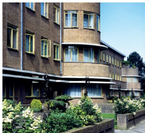
Woonhotel aan de Van Hogenhoucklaan

Bij de bespreking van de ontwikkelingen na 1945 kunnen diverse lijnen worden doorgetrokken van vroeger naar nu. Na een periode van