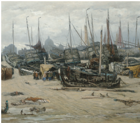
H.W. Mesdag, Na de storm van 1894 (coll. Panorama Mesdag)