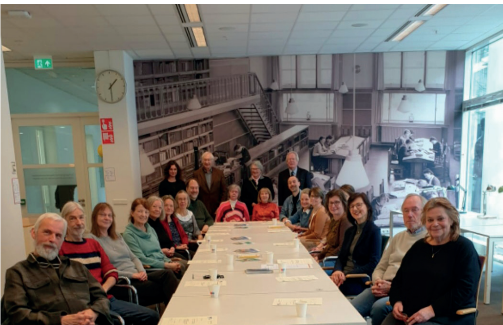
Diploma uitreiking cursisten paleografie